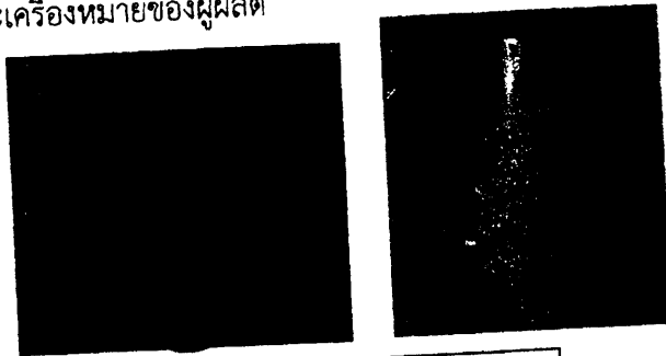
ภาพตัวอย่างประเด็นที่ ๒

ประเด็นที่ ๒ : การติดชื่อหรือโลโก้ของโรงงานยาสูบที่บรรดาของแจกและของแถมของโรงงานยาสูบ ที่ให้กับคู่ค้า ซึ่งได้แก่ ร้านขายส่ง, ร้านขายปลีก กรณีนี้ขัดกับมาตรา ๓๒ แห่งพระราชบัญญัติควบคุมผลิตภัณฑ์ยาสูบ พ.ศ. ๒๕๖๐ เนื่องจากเป็นการนำชื่อและเครื่องหมายของผู้ผลิตไปแสดงบนผลิตภัณฑ์อื่นใด ที่ไม่ใช่ผลิตภัณฑ์ยาสูบ เพื่อการโฆษณาชื่อและเครื่องหมายของผู้ผลิต